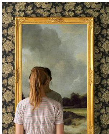
Bild: JULIAN BIRBRAJER INVERSIONS . Vid närmare studium visar sig hela spegelbilden vara en målning.

HAR INTE VARJE barndom en egen färglära? "Green is the new black", är en inledande titel. Sedan följer spanska färgord. Verde (grönt) skrivs svart mot gult. Amarillo (gult) skrivs svart mot grönt. Vad är sant – det vi ser som färg eller det vi läser? Jag kan djupast sett