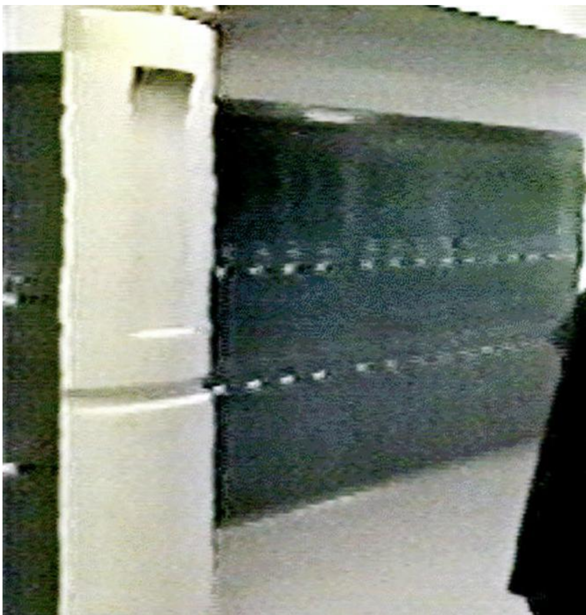
COLUMBINE HIGH SCHOOL. Eric Harris, t v och Dylan Klebold dödade tretton människor, sårade tjugofyra och tog sedan